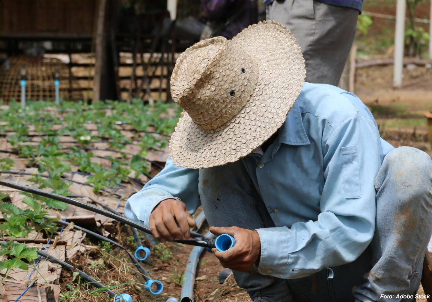
Gwo chapo pwoteje moun kont gwo kout chalè.